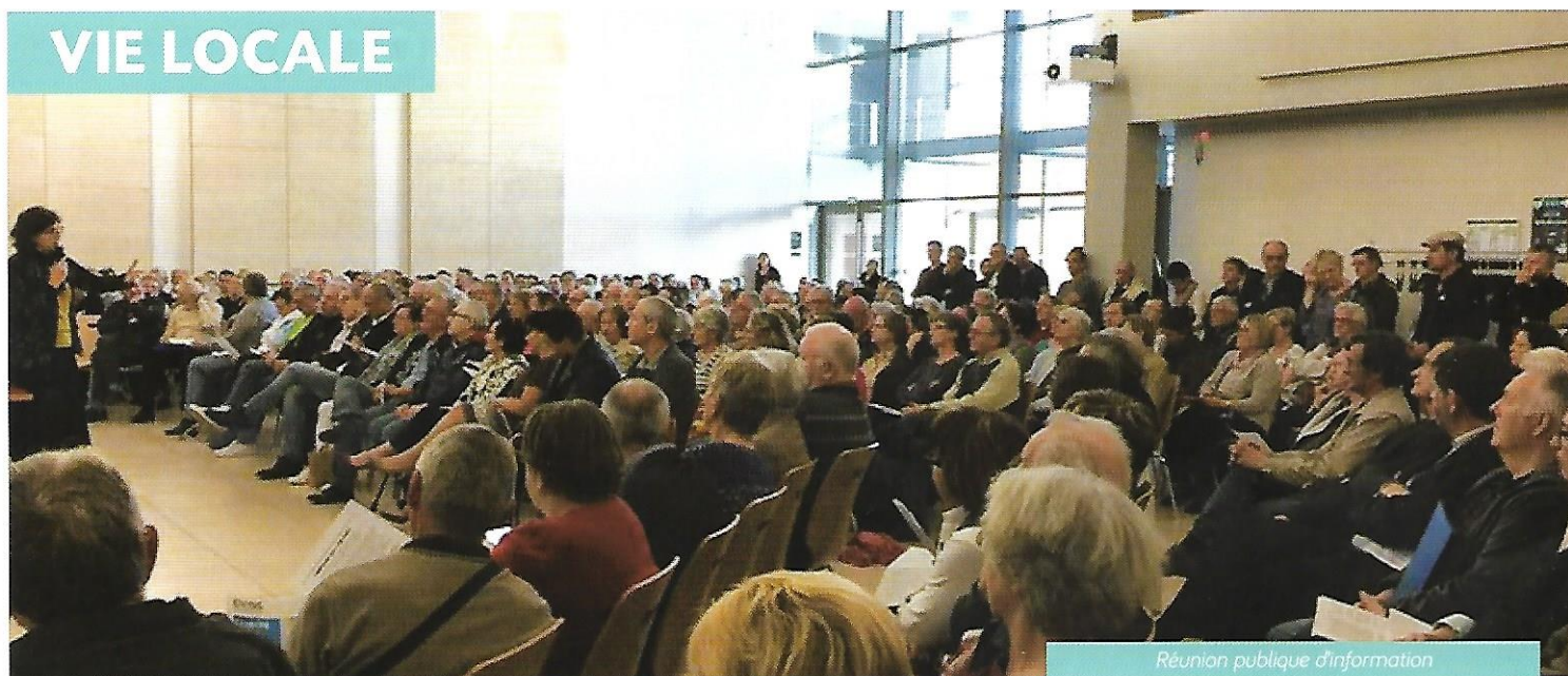
Réunion publique d'information